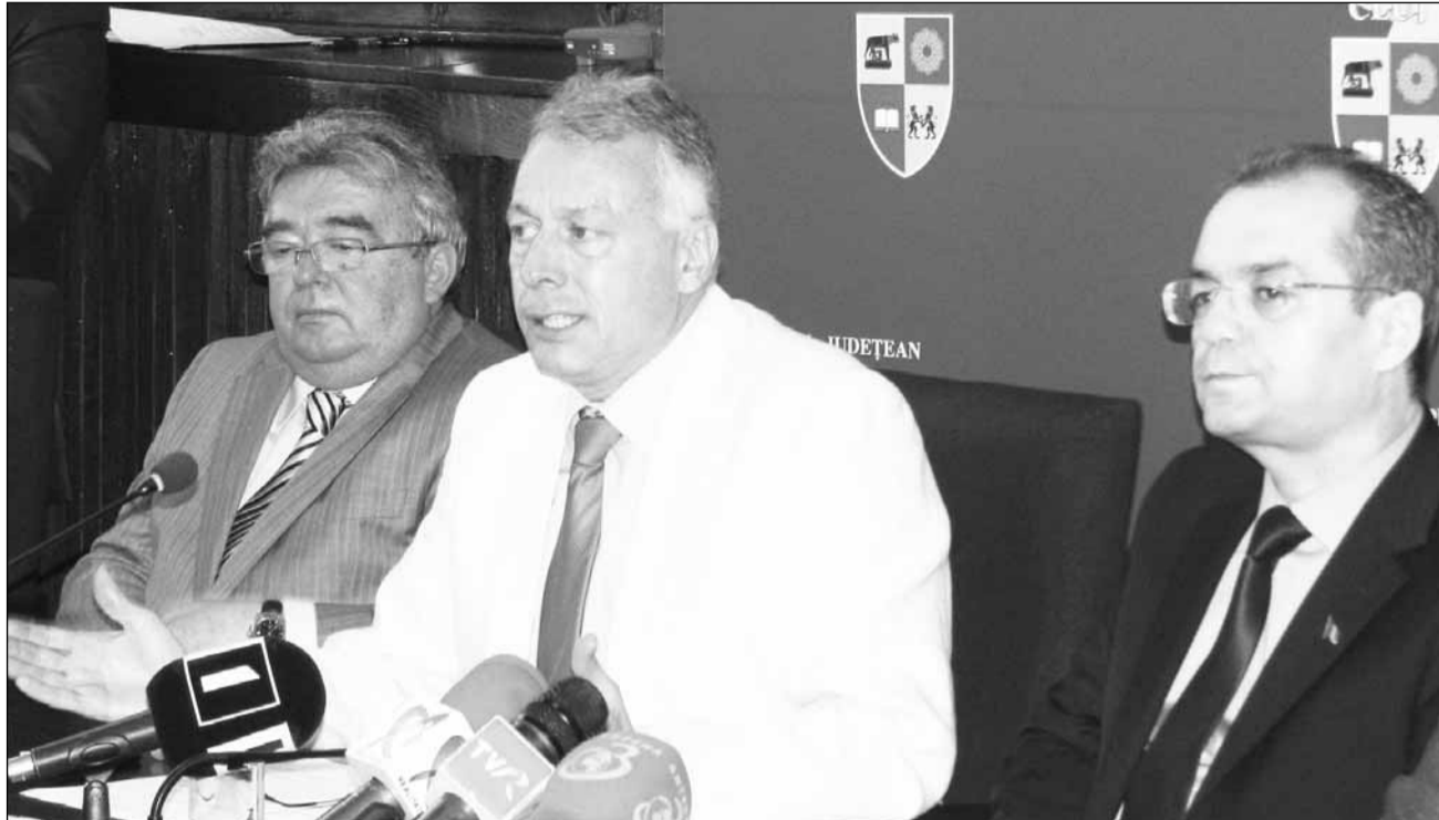
Ministrul Mediului și Pădurilor, László Borbély, are trecere la șeful Guvernului

De asemenea, banii pentru Ministerul Muncii au fost tăiați cu 1,3 miliarde. Astfel, Ministerul Muncii va primi, anul viitor, puțin sub 32 de miliarde de lei.