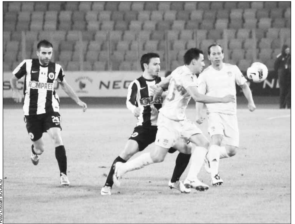
FC Vaslui a învins la Cluj și a trecut în fața Universității în clasamentul Ligii 1