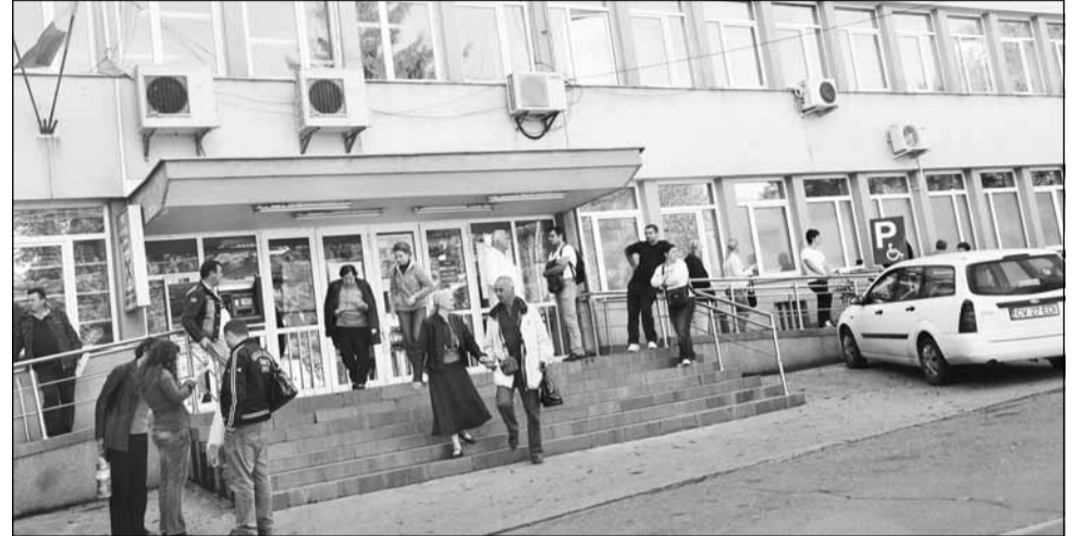
În lipsa unor camere sterile, în timpul tratamentului, bolnavii de cancer pot contracta infecții fatale

Pentru strângerea sumei necesare, asociația a început