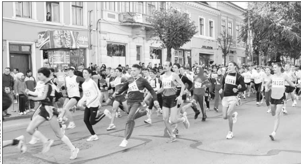
Angajații companiilor sunt așteptați să alerge în 16 octombrie

Potrivit organizatorilor, Crosul Companiilor promovează un mod de viață sănătos prin practicarea alergării, având și valențe educative, care țin de trăsăturile unui angajat model într-o companie. „Pe de altă parte, crosul crează cadrul în care, prin asocierea cu valorile tradiționale ale sportului, companiile își afirmă valorile orga-