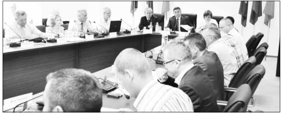
Consiliul Județean Cluj a demarat o licitație privind construcția a trei stații de transfer în Cluj

Până în prezent, proiectul nu a putut fi pus în aplicare, fiind blocat constant de contestații. Practic, firmele aflate pe locul al doilea (Confort SA, Atzwanger SPA, Lardner Impianti SRL și Vel Service SA) s-au încăpățânat să conteste fiecare decizie a comisiei de licitație a Consiliului Județean, iar CNSC le-a dat câștig de cauză de fiecare dată.