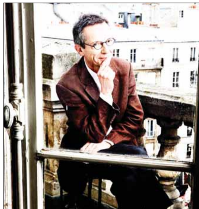
Patrice Leconte, actor și regizor de marcă, va fi invitatul de onoare a Festivalului Filmului Francez

În acest an, organizatorii festivalului au grupat filmele în șapte secțiuni: „Avanpremiere” – cu nouă filme turnate în 2010 și 2011, la prima lor vizionare în România; „Filme și putere” – cu patru producții recente pe teme politice de actualitate; „Retrospectiva Patrice Leconte”; „Decouverte” – cu trei filme noi ale unor tinere talente; „Animatie”; „Documentar” și „Scurtmetraje”.