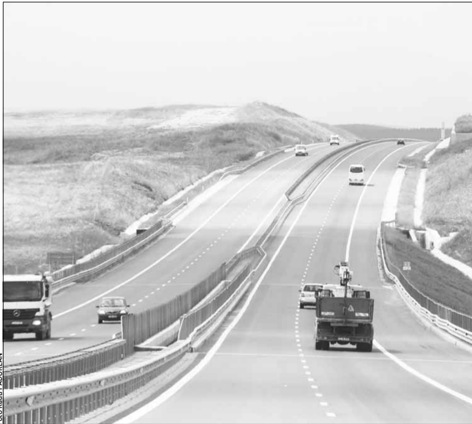
Transporturile alocă echivalentul a 84 de milioane de euro în plus pentru Autostrada Transilvania

„Principalele proiecte pentru care au fost suplimentate prevederile bugetare sunt: autostrada Brașov-Cluj-Borș (335 milioane lei); autostrada București-Brașov (291,8 milioane lei); varianta de ocolire a Municipiului Timișoara (54,4 milioane lei). De asemenea, a fost suplimentată prevederea bugetară aferentă activității de întreținere a infrastructurii rutiere cu suma de 166,64 milioane lei. Menționăm că toate aceste suplimentări au avut la baza în primul rând realocări de fonduri în cadrul bugetului aprobat, la care s-a adăugat suplimentarea de 270 milioane lei urmare rectificării prin OG nr. 10/2011”, se arată în nota de fundamentare a unui proiect de HG elaborat de Ministerul Transporturilor.