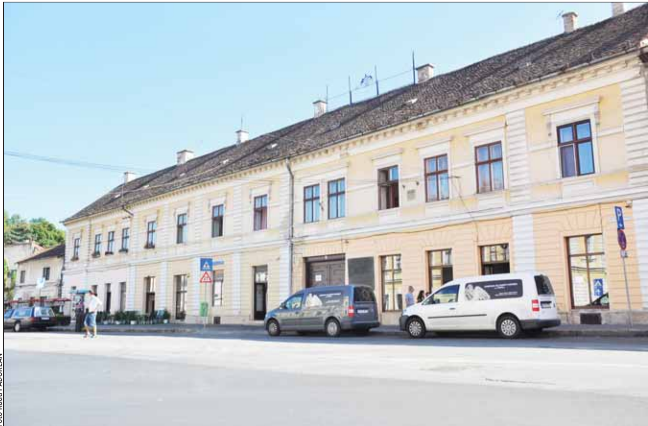
Restaurantul „Biasini” este unul dintre puținele localuri clujene care mai există și astăzi în același imobil, păstrându-și chiar și denumirea inițială

Cafeneaua hotelului a devenit în acea perioadă locul favorit al studenților români, care organizau aici întâlniri și manifestări. Între 24 noiembrie și 8 decembrie 1846, una din camerele hotelului a fost ocupată de celebrul compozitor și pianist Franz Liszt, iar între 21 și 24 octombrie 1847, la hotelul Biasini a poposit Petofi Sandor cu so-