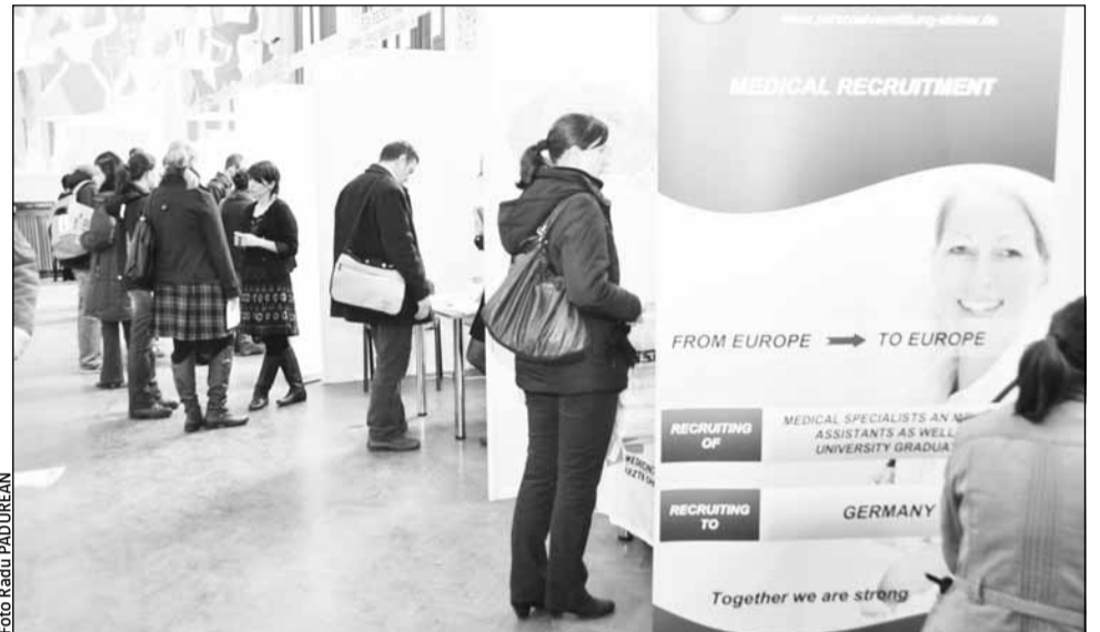
Ofertele de muncă în străinătate par să fie singura opțiune pentru medicii rămași fără loc de muncă, dar mulți se tem să plece să profeseze în altă țară

Cei care insistă totuși să profeseze în domeniul medical au șanse extrem de reduse de a prinde un loc de muncă în condițiile în care posturile în sistemul de stat sunt blocate, iar în