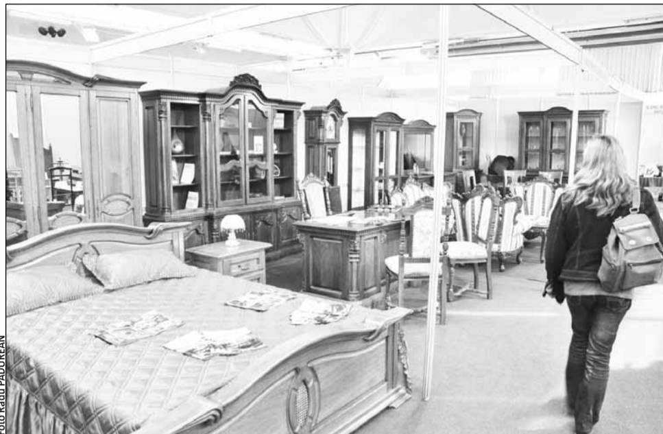
60% din mobilierul produs în România e destinat exportului, fiind vorba în general de produse din lemn masiv

Exporturile de mobilă au crescut, în prima jumătate a anului, cu 18%, la 572,5 milioane euro. Calitatea superioară a mobilierului, dar și