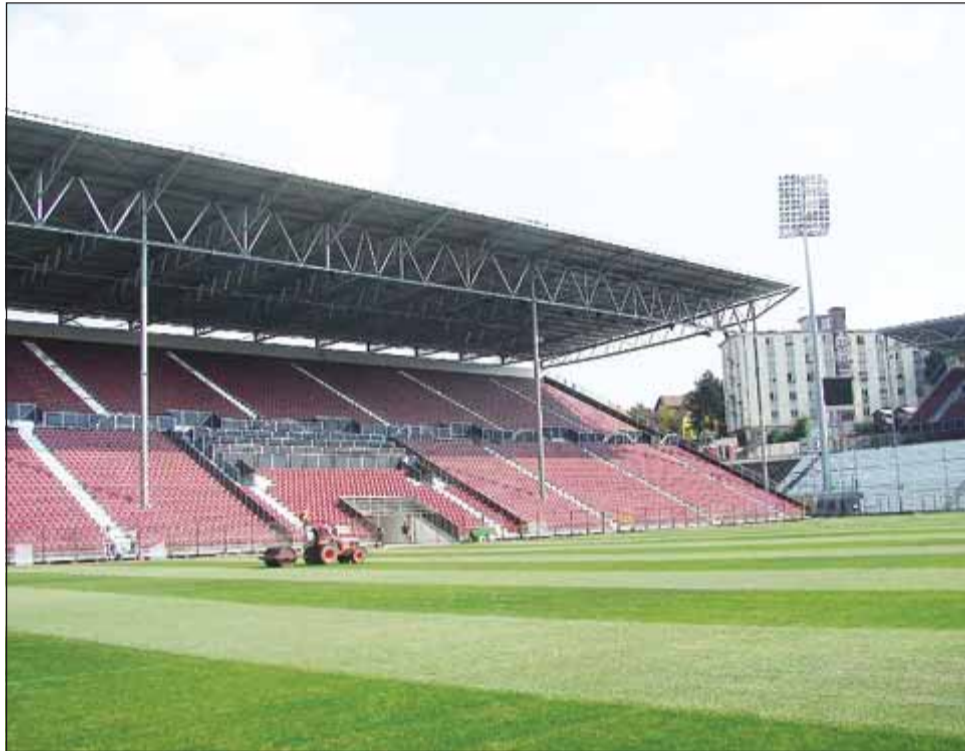
Stadionul "Dr. Constantin Rădulescu" din Gruia ar putea trece în proprietatea Consiliului Județean Cluj, pentru a fi modernizat