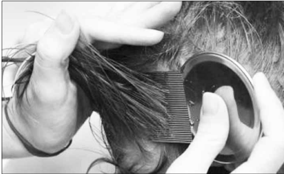
La începutul acestui an școlar, medicii au controlat peste 78.000 de elevi din tot județul Cluj, fiind descoperiți copii cu amigdalite, diaree, răie și păduchi.

Potrivit datelor centralizate de Direcția de Sănătate Publică (DSP) Cluj, numărul total al elevilor bolnavi la început de an școlar a fost de 1.240. Într-un posibil top al bolilor depistate în urma triajului epidemiologic conduc detașat anginele acute cu 838 de cazuri, din care 7 au fost streptococice. Specialiștii aten-