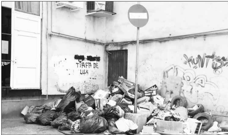
După o serie lungă de întârzieri datorate contestațiilor, proiectul Centrului de Management Integrat al Deșeurilor poate fi demarat

„După o serie prea lungă de întârzieri datorate contestațiilor suntem acum în măsură să demarăm acest proiect extrem de important pentru județul Cluj. Licitația a pornit de la 33 milioane de euro, iar consorțiul Confort s-a angajat să realizeze acest obiectiv pentru 25