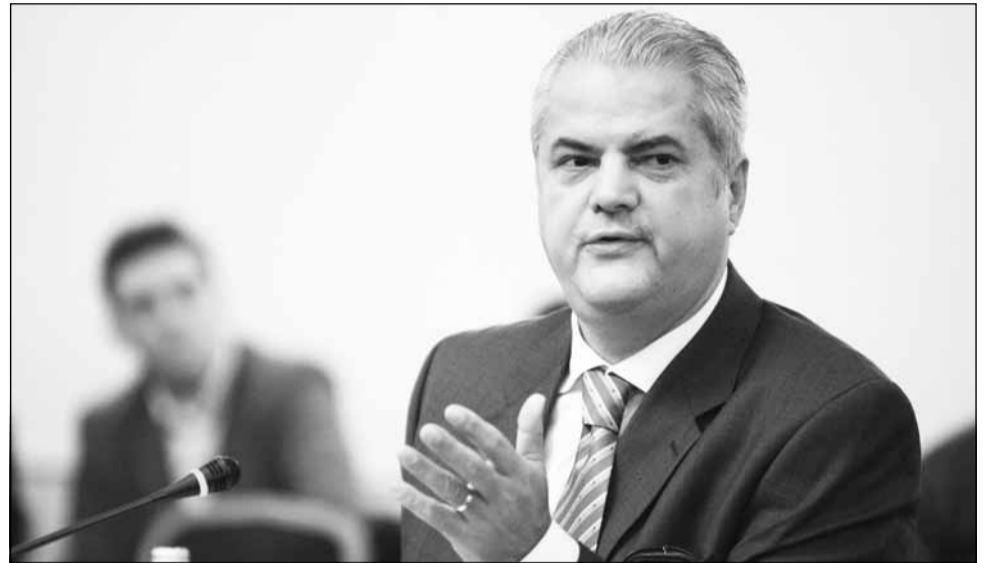
Liderul Consiliului Național al PSD crede că partidul trebuie să tragă învățături din eșecul tentativei de înlocuire a lui Mircea Geoană

Senatorul clujean PSD Alexandru Cordoș subliniază însă că PSD va continua ceea ce a început în ceea ce privește înlocuirea lui Geoană. „Continuăm cu ceea ce am început, este vorba despre înlocuirea sa cu Titus Corlățean. Vom discuta și vom analiza în grupul senatorilor această chestiune. S-a văzut că toată lumea își dorește această funcție și nu vrem să pierdem această funcție în stat. Cât despre plecarea lui Mircea Geoană la UNPR sau în altă parte, chiar el a precizat că nu are această intenție. Eu nu am cunoștințe despre așa ceva”,