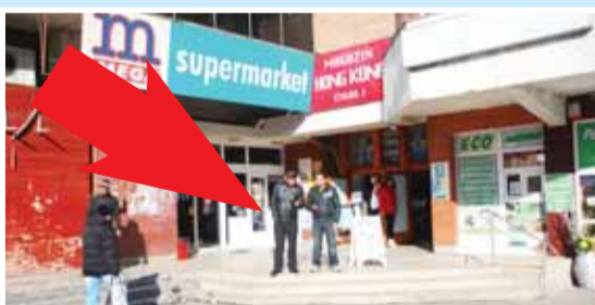
Magazin Mega SuperMarket, Hala Agroalimentară