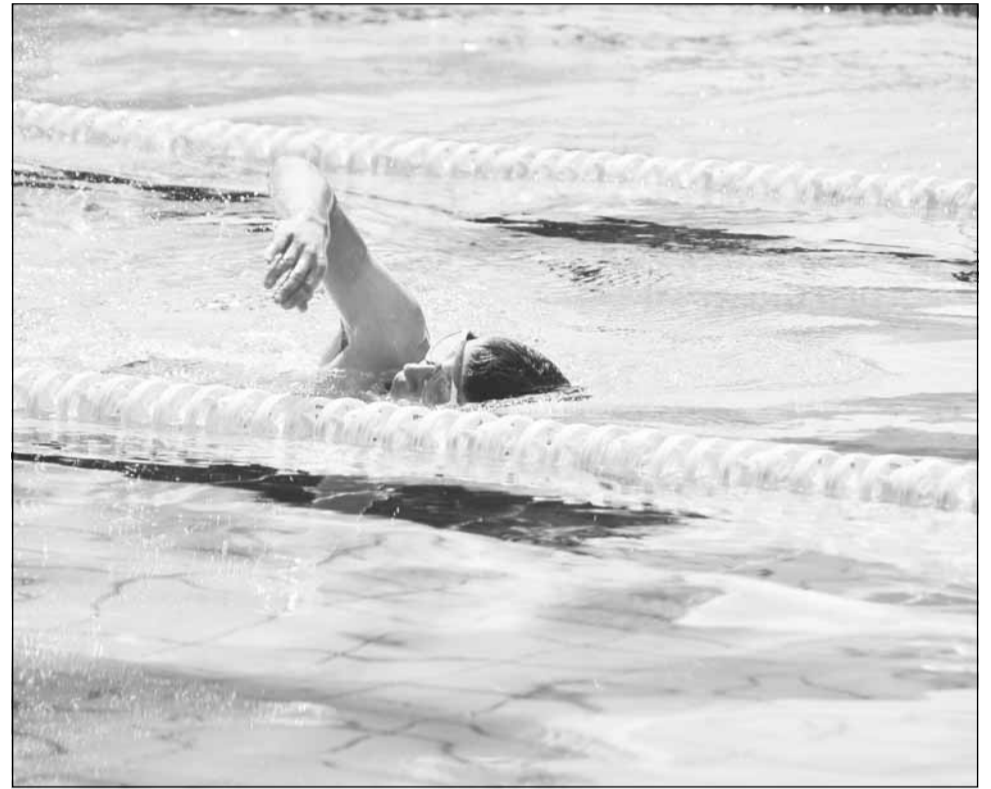
FCC acordă 10 burse din fondul consolidat în urma edițiilor 2010 și 2011 ale concursului caritabil de înot Swimathon

„Pentru a produce o schimbare cu impact pe termen lung în viața acestor tineri, le urmărim îndeaproape evoluția școlară și situația familială, încercând să ne asigurăm că vor absolvi cu succes liceul și că pot privi, la rândul lor, în perspectivă, spre facultate și o viitoare profesie sau carieră. Iar pentru cei care au nevoi suplimentare – și acestea nu sunt puține – atragem noi resurse prin mecanisme și campanii precum cea susținută de Swimathon,