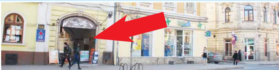
Studio Foto Best Media Factor, str. Memorandumului nr. 23, etaj I, ap. 10