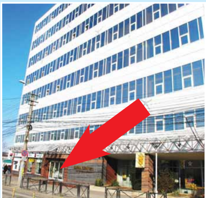
SIGMA Business Center Cluj-Napoca, str. Republicii nr. 109, etaj I