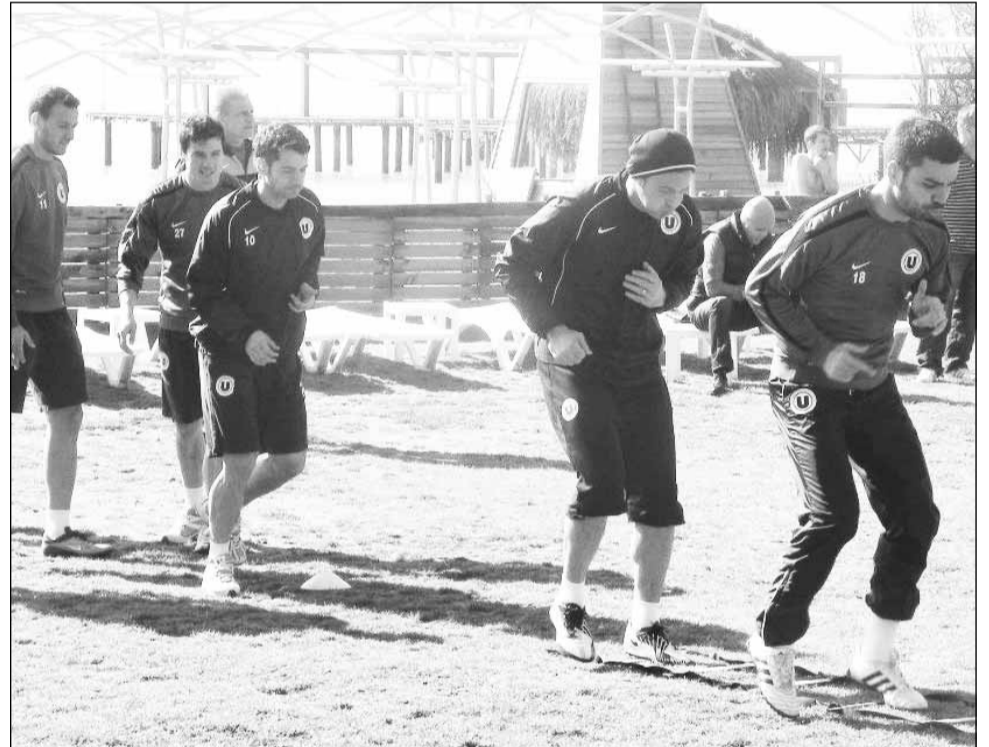
Fotbaliștii Universității se pregătesc la +14 grade Celsius