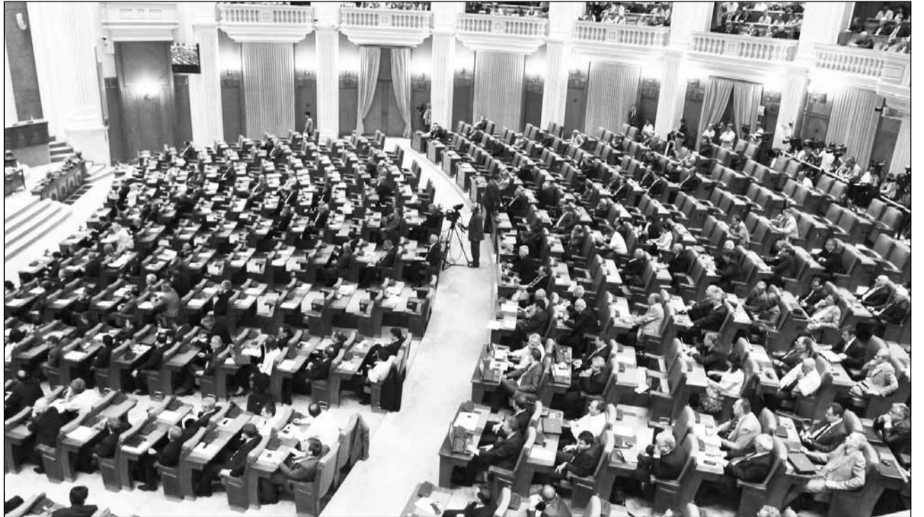
Reducerea numărului de aleși va necesita noi negocieri în rândurile puterii

În urmă cu câteva săptămâni, Coaliția a convenit asupra reducerii numărului de parlamentari de la 471 la 388 și totodată asupra schimbării sistemului de vot. Luni, surse citate de Mediafax susțin că PDL a renunțat la varianta stabilită în coaliție, la propunerea UDMR, privind reducerea numărului de parlamentari la 388, după ce a constatat că aplicarea unei asemenea formule avantajează UDMR, care ar câștiga mai multe mandate de senatori. Din acest motiv, PDL a renunțat la această variantă de re-