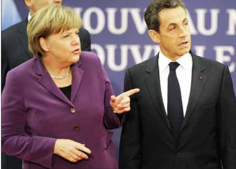
Specialiștii consultați de Monitorul de Cluj pariază pe o „impunere forțată a propunerilor” făcute de președintele francez Nicolas Sarkozy și cancelarul german Angela Merkel

Printre ele se numără și hotărârea supranumită „regula de aur”, care presupune aplicarea de sancțiuni pentru statele care nu vor respecta ținta de deficit bugetar de cel mult 3% din produsul intern brut (PIB). Cei doi vor ca