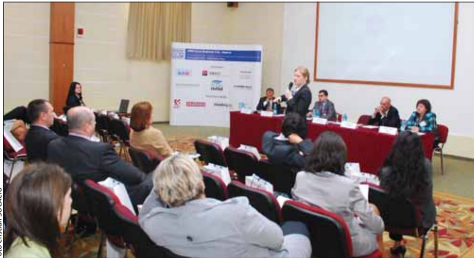
Reprezentanții IMM-urilor din regiune se plâng de întârzierile cu care își primesc banii în urma proiectelor europene câștigate

Contactați de monitorul , consilierii câtorva firme clujene de consultanță au spus fie că nu cunosc să existe corupție în sistem, fie că aceasta s-ar putea să apară, însă doar în cazul Programului Operațional Sectorial Creșterea Com-