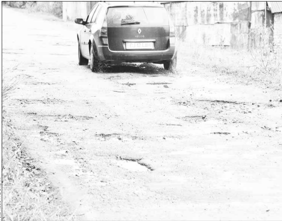
Lipsa autostrăzilor și starea proastă a drumurilor județene stau în calea dezvoltării economice a Clujului, spun la unison întreprinzătorii și transportatorii