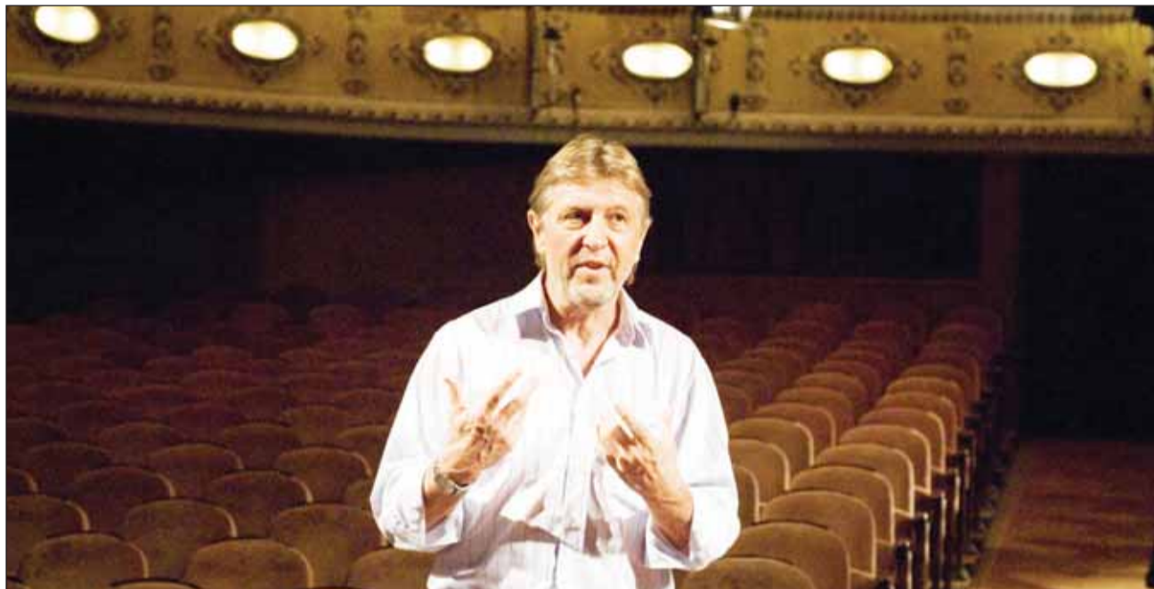
Regizorul Andrei Șerban va monta pe scena Teatrului Maghiar din Cluj piesa „Hedda Gabler”

Robert Woodruff montează adaptarea filmului „Ani-