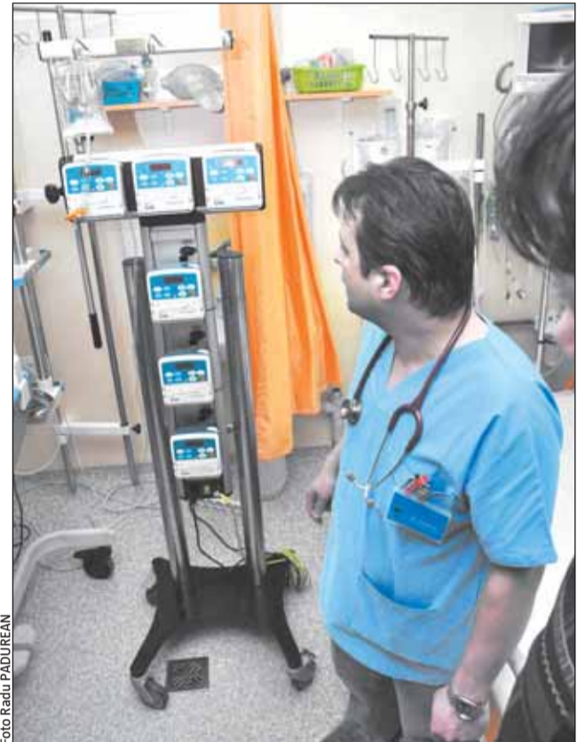
Dotarea spitalelor cu aparatură modernă ar reduce numărul zilelor de spitalizare și al cazurilor de infecții, dar și costurile pe termen lung din instituțiile medicale

Potrivit reprezentanților companiei, este importantă și