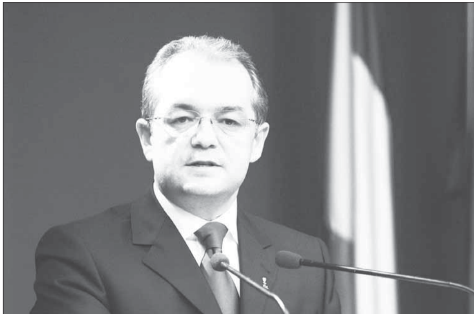
Premierul Emil Boc susține că Opoziția că nu ține cont de interesul național când vine vorba de proiectul revizuirii Constituției, dar reprezentanții USL Cluj spun că e exact invers

Potrivit liderului PDL, Emil Boc, opțiunea Opoziției de a nu susține modificarea Constituției în mandatul actual reprezintă o greșală, pentru că nu se ține cont de interesul național, acest fapt reprezentând o sfidare a cadrului fundamental al democrației. „Aș face o considerație referitoare la opțiunea Opoziției de a nu susține în acest mandat