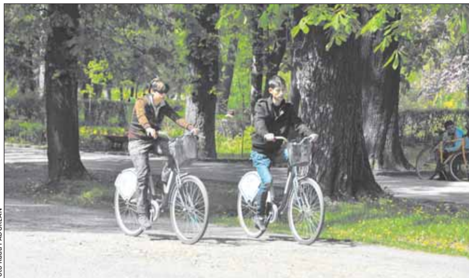
Cele două programe implementate până acum în Cluj-Napoca în ceea ce privește bike-sharing-ul au avut succes printre clujeni

În prezent, proiectul se află în faza de precontractare, existând posibilitatea ca semnarea contractului de finanțare europeană să aibă loc până la finalul acestei luni. „Succesul unui oraș care se vrea capitală europeană ține de modernizarea infrastructurii de transport. Această rețea de stații pentru biciclete reprezintă o posibilitate de mobilitate urbană. Clujenii vor putea ajunge dintr-un loc în altul cu o bicicletă luată dintr-una din cele 50 de stații pe baza unui chip-card eliberat de Primărie în baza actului de identitate și a unei sume modice”, a arătat primarul Clujului.