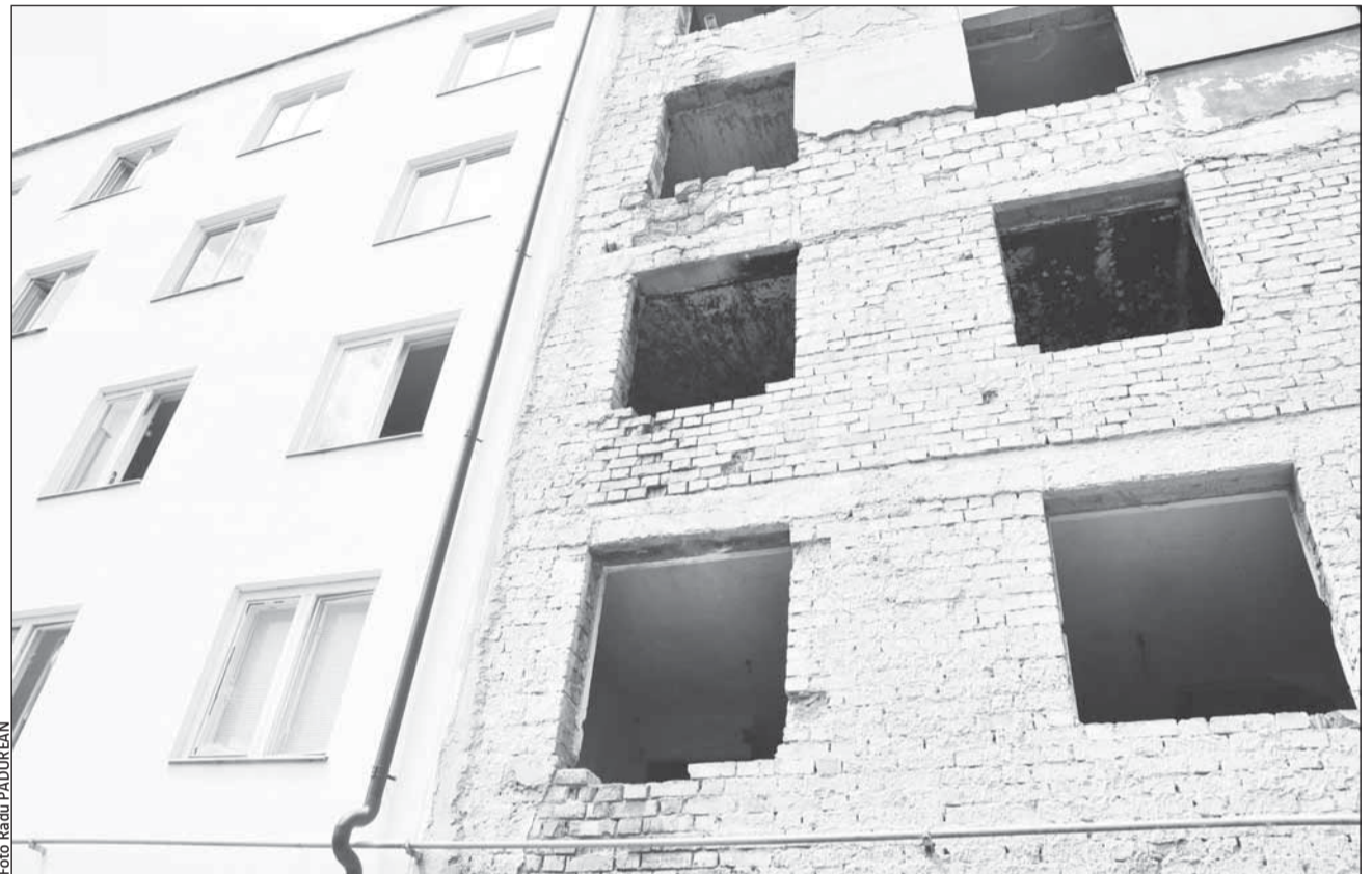
Săptămâna aceasta va fi semnat contractul de finanțare pentru locuințele sociale de pe Albac

În imobilul din cartierul Gheorgheni, de pe strada Albac nr. 21, vor fi realizate, prin reconversie funcțională, 24 de locuințe sociale. Fiecare dintre cele 24 de locuințe sociale vor dispune de o cameră de zi, precum și de o baie și bucătărie individuale. La parterul blocului se vor amenaja opt apartamente, iar la eta-