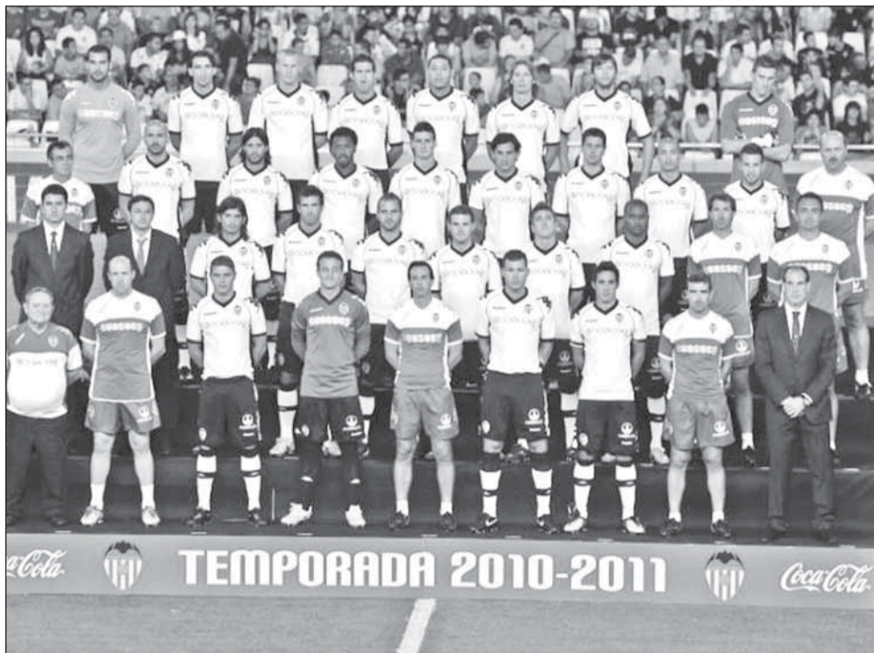
„Liliecii” vor juca cu „șepcile roșii” peste mai puțin de o lună

Este interesant faptul că Universitatea Cluj și Valencia CF au fost înființate în același an, 1919 și au aceleași culori: alb-negru. Clubul „lilieciilor” este al treilea în topul preferințelor iubitorilor de fotbal din Spania, fiind depășit doar de Real Madrid și FC Barcelona. Valencia este unul dintre puținele cluburi din Europa care a ajuns cel puțin în finală în toate cele trei competiții continentale. „Alb-negrii” iberici au câștigat Cupa Cupelor