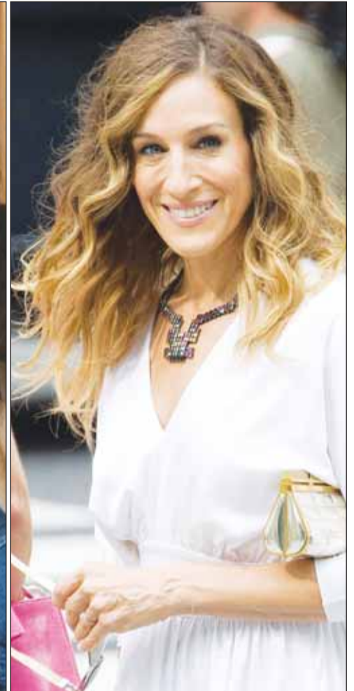
Angelina Jolie și Sarah Jessica Parker au primit în ultimele 12 luni un salariu de 30 de milioane de dolari