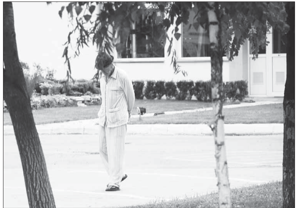
Medicii de familie atrag atenția că pacienții au acces din ce în ce mai greu la servicii medicale și medicamente