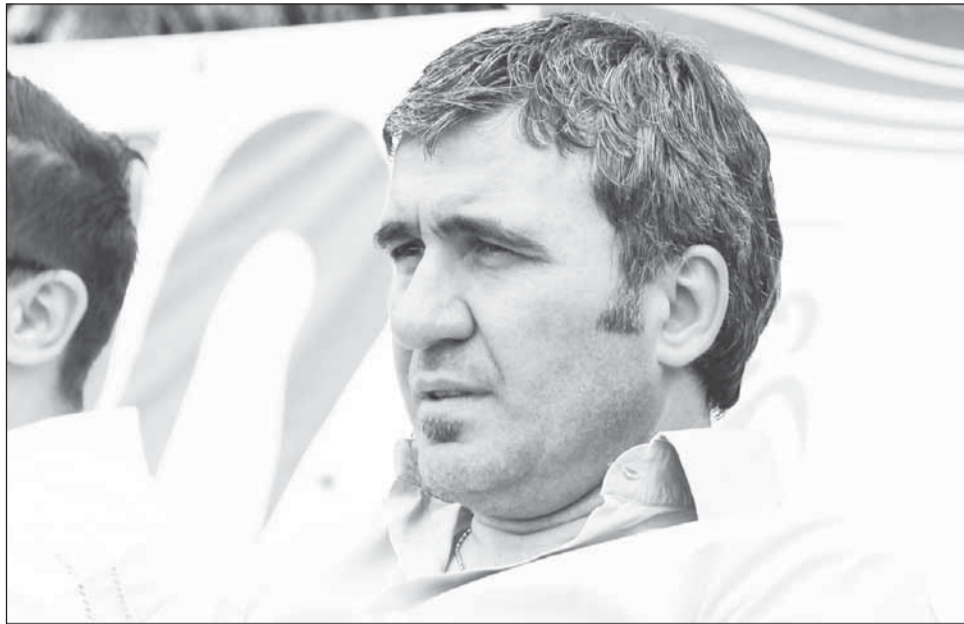
Hagi e aproape de o revenire la națională

„În cursul zilei 5 iunie, domnul Răzvan Lucescu i-a reconfirmat președintelui Federației Române de Fotbal, domnul Mircea Sandu, că renunță la conducerea tehnică a echipei naționale a României, decizie definitivă și irevocabilă. În atare condiții, profitând și de faptul că aceștia se aflau în București, președintele FRF a avut întâlniri