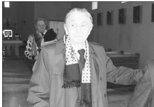
De numele lui Mircea Dimitrie Rațiu se leagă numeroase invenții și teste de siguranța reactoarelor nucleare la cutremur, recunoscute pe plan internațional

Înainte de asta însă, face clasele primare la școala greco-catolică din Turda unde își ia cu brio examenele de echivalare, astfel încât la sfârșitul anului e citat ca elev excepțional pe școală și primește locul I cu cunună la nivelul școlii primare. Anii de școală îi sunt marcați de o cazătură din copilărie, din timpul unui meci de fotbal. În 13 martie 1933, Mircea Rațiu cade pe un parapet din beton și își fracturează grav brațul, cotul fiind complet sfărâmat. În urma unei operații de cinci ore, profesorul