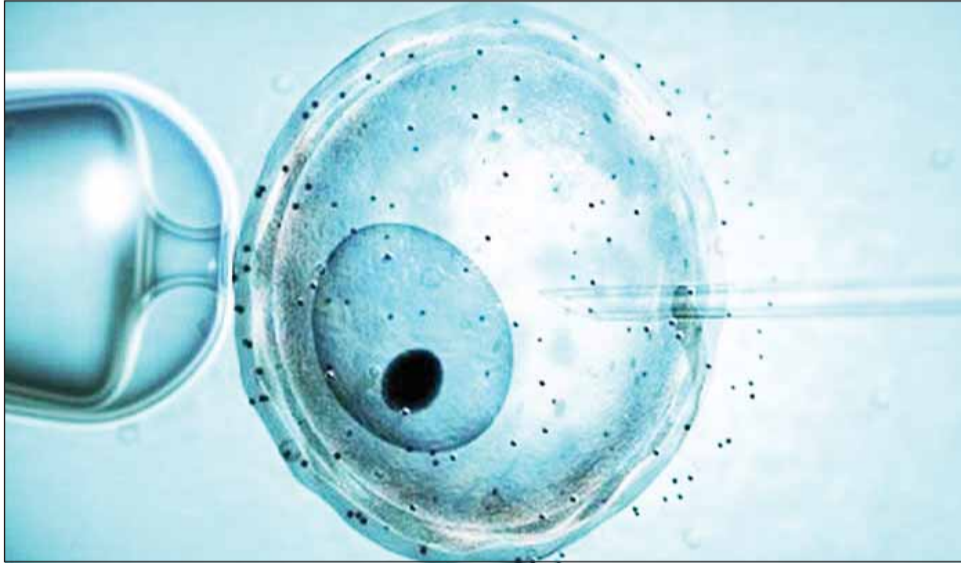
Opt clinici din București, Cluj-Napoca, Iași, Timișoara, Brașov și Sibiu au fost admise, până la această dată, pentru a derula programul de fertilizare in-vitro gratuită

„Ministerul Sănătății menține recomandarea adresată unităților sanitare care derulează subprogramul de fertilizare in-vitro și embriotransfer (FIV/ET), să efectueze o verificare preliminară a dosarelor depuse de cuplurile interesate înainte de transmiterea dosarelor către Ministerul Sănătății, întrucât Comisia