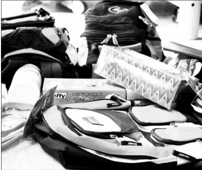
Rechizitele necesare unui copil care începe clasa I pot costa între 75 și 450 de lei.

Rechizitele scoase la vânzare în cadrul târgului au prețuri promoționale. Astfel, de exemplu, un caiet de matematică de 32 file costă 30 de bani, unul de 80 de file, 80 bani, un ghiozdan