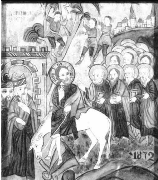
Savu Moga, Intrarea în Ierusalim a Domnului , icoană pe sticlă, 1872, Muzeul Național al Tăranului Român, București.

În decursul secolelor, iconografia temei s-a modificat prin detalii pitorești precum: