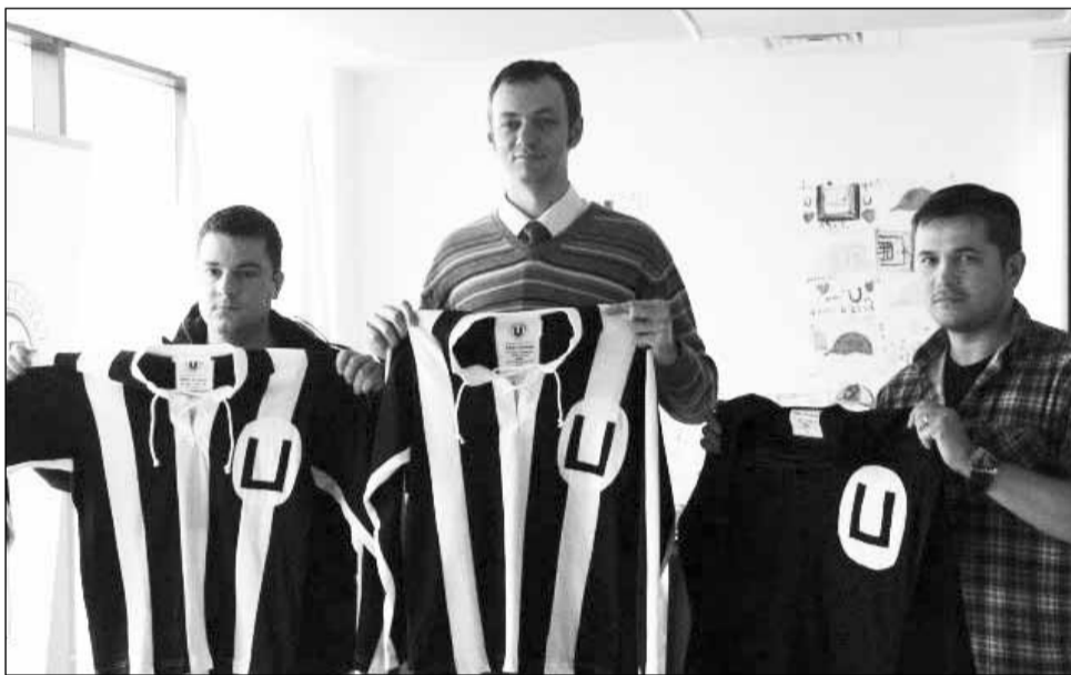
FCC finanțează trei proiecte sportive și susține financiar cinci tineri sportivi din fondul constituit în urma licitației celor 24 de tricouri de colecție marca U Cluj

Cele trei proiecte finanțate în urma primei campanii de atragere de fonduri derulate de FCC în parteneriat cu FC Universitatea Cluj au fost propuse de Centrul și Clubul Sportiv Lamont (valoare grant: 3.000 de lei), Liceul pentru Deficienți de Vedere (valoare grant: 3.000 de lei) și Asociația pentru Turism