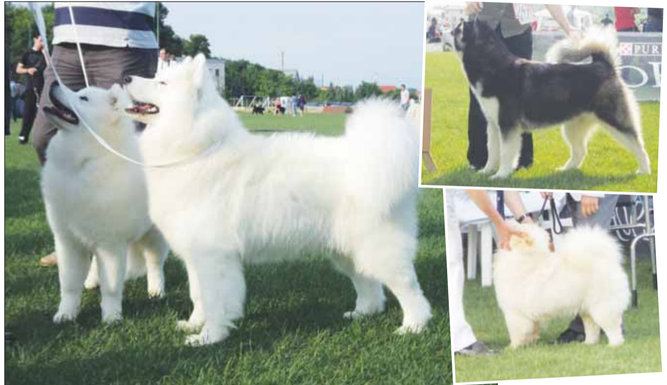
Cei mai frumoși câini din țară și străinătate s-au întrecut în weekend la Napoca Dog Show

Pe parcursul zilei, spectatorii s-au putut delecta și cu un spectacol special realizat de Terra Dacica Aeterna. Cei mai încantați au fost copiii care au putut să participe la lupete cu arme asemănătoare celor folosite de daci și romani. De asemenea, a putut fi admirată vestimentația dacilor și romanilor.