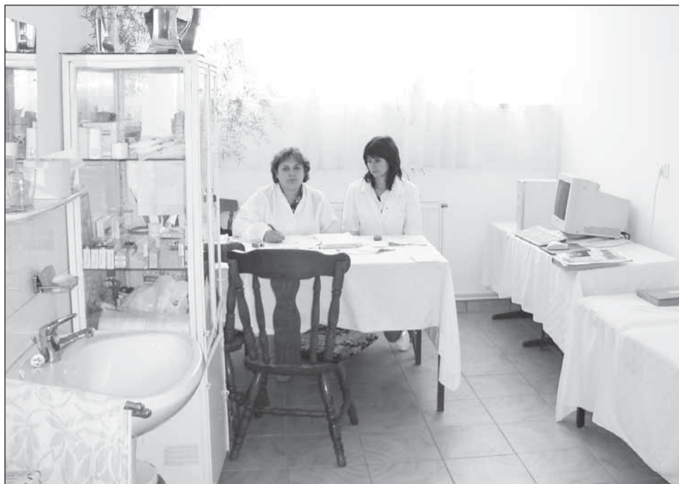
Conflictul dintre medicii de familie și Casa Națională de Asigurări de Sănătate pare departe de a fi stins

Medicii refuză însă să se prezinte la CAS pentru semnarea actelor adiționale pe motiv că acestea sunt ilegale.