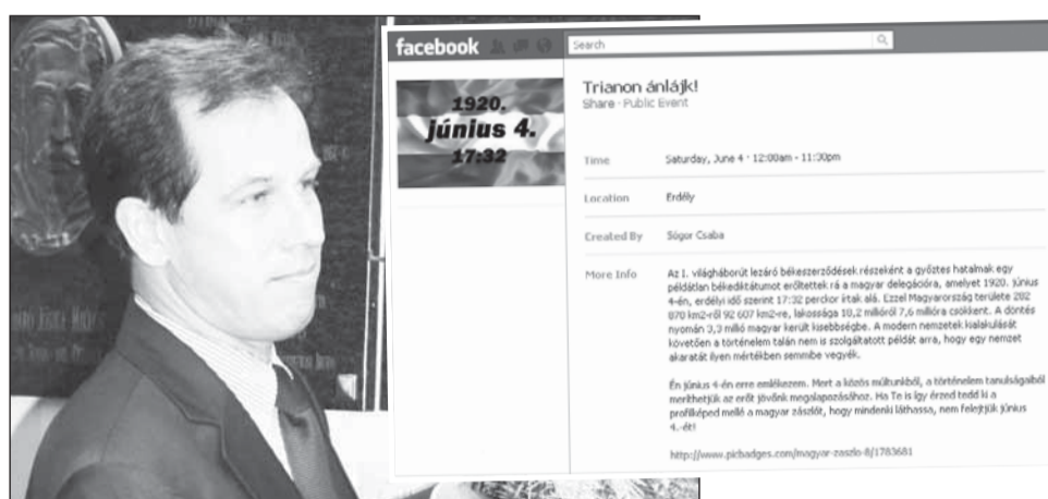
Europarlamentarul maghiar Sogor Csaba a postat pe pagina de Facebook mesajul „Trianon anljak”, cu referire la Tratatul de pace semnat în 4 iunie 1920 de Ungaria

Reprezentanții PSD și cei ai Partidului Conservator consideră că atitudinea europarlamentarului maghiar este exagerată, iar mesajul său este