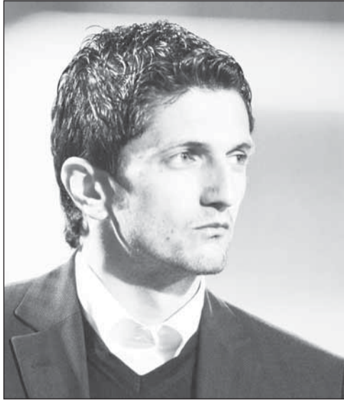
După plecarea lui Lucescu, Hagi pare dornic să preia naționala României