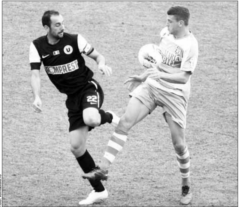
Voința Sibiu și Universitatea Cluj au remizat pe un teren greu