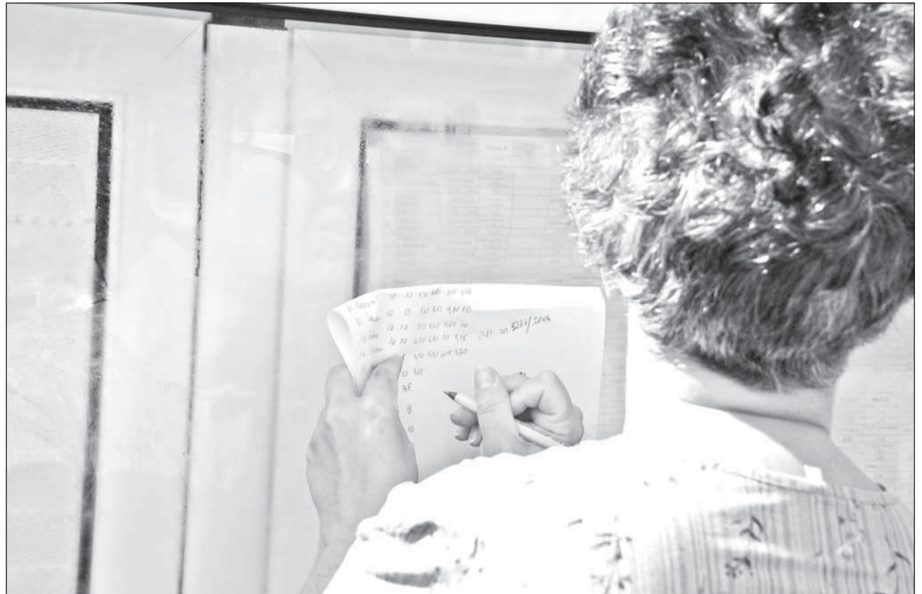
Clujul, cu o promovabilitate de 54,07% la examenul de Bacalaureat, ocupă locul 9 în clasamentul pe județe

Pe de altă parte, cheltuielile cu educația reprezintă, în medie, numai 0,7% din bugetul lunar al unei familii, potrivit datelor Institutului Național de Statistică (INS). Astfel, resursele infime alocate educației s-ar putea număra