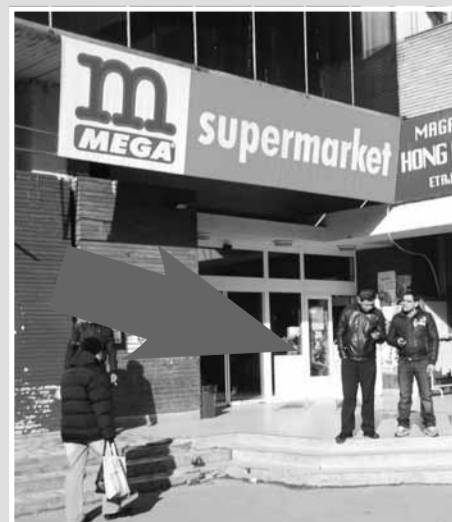
Magazin Mega SuperMarket, Hala Agroalimentară