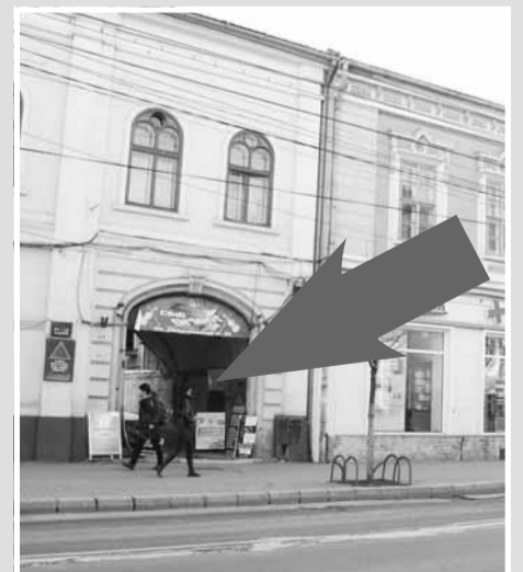
Studio Foto Best Media Factor, str. Memorandumului nr. 23, etaj I, ap. 10