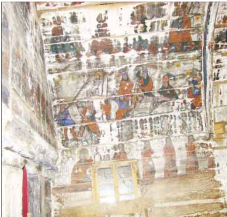
Biserica din lemn din Calna, fragment de pictură din naos

Anul acesta județul Cluj va avea finanțarea disponibilă pentru a începe restaurarea la 12 monumente istorice. Astfel, pe listă se află Biserica de Lemn Sf. Arhangheli Mihail și Gavril din satul Calna, comuna Vad, Biseri-