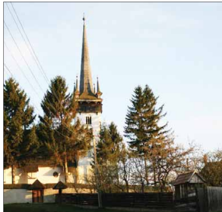
Biserica Reformată din satul Mănăstireni

De asemenea, anul acesta vor fi restaurate Biserica Mănăstur Calvaria,