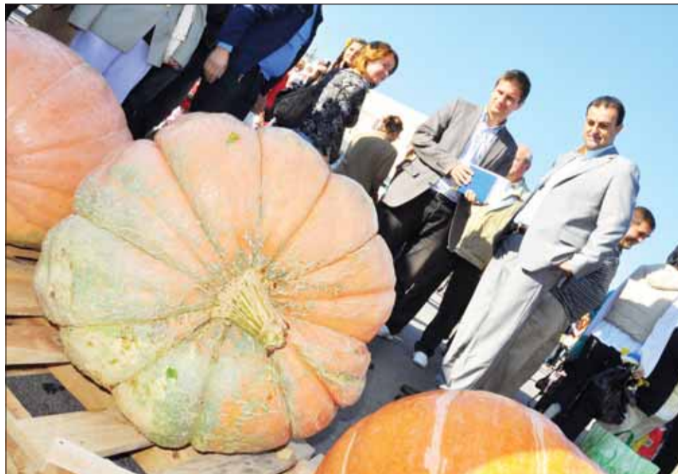
Dovleac de 100 kg, premiat la Ziua Recoltei

„Mii de clujeni au luat cu asalt, încă de la primele ore ale dimineții, standurile de produse agricole amenajate la Sala Sporturilor. Cei care nu și-au făcut provizii pentru această iarnă au avut ocazia să achiziționeze produse proaspete, direct de la producător, la prețuri accesibile”, au arătat reprezentanții Primăriei prin intermediul unui comunicat de presă. Ast-