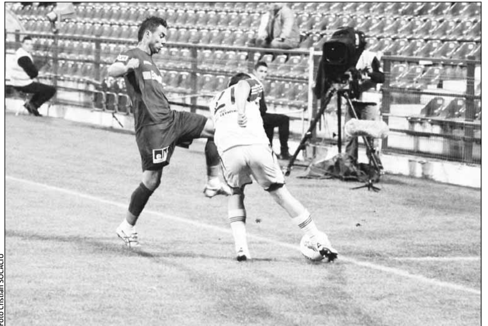
„Feroviarii” nu au reușit să se impună în fața Petrolului

În ciuda faptului că elevii săi nu au câștigat meciul cu Petrolul, Jorge Costa a declarat că câștigat o echipă și a precizat că este sigur că va cuceri titlul. „Am întâlnit o echipă care a venit pentru a nu pierde. Am muncit, am avut șanse de a marca. Singurul lucru care nu a mers a fost că nu am câștigat. Nu vreau să vorbesc despre arbitru, nu știu nici cum îl cheamă, nici dacă e competent sau nu. Azi am arătat multă forță. Am câștigat o echipă și e clar că vom