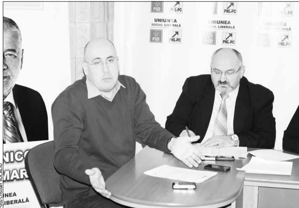
Consilierii USL cer ca amendamentele lor să fie incluse în forma finală a bugetului general al municipiului

Astfel, pentru infrastructură, consilierii USL au prezentat principalele obiective pe care reprezentanții administrației locale ar trebui să le aibă în vedere la votarea bugetului pe anul în curs. Includearea în bugetul local a sumelor necesare pentru Șoseaua Urbană Cluj-Napoca Sud, pentru demararea investiției multianuale la acest proiect este unul dintre acestea. O altă propunere se referă la transferarea de la Ministerul Dezvoltării Regionale și Turismului a străzilor Oașului și Borhanci și „alocarea de resurse financiare concrete în lista de investiții pe care se fundamentează bugetul, pentru demararea și finalizarea acestor obiective până la sfârșitul anului”. Totodată, reprezentanții USL propun preluarea de la CNADNR a Străzii Bună Ziua, includerea resurselor financiare în bugetul local pentru realizarea trotuarelor și totodată, repararea imobilelor din patrimoniul privat al Primăriei.