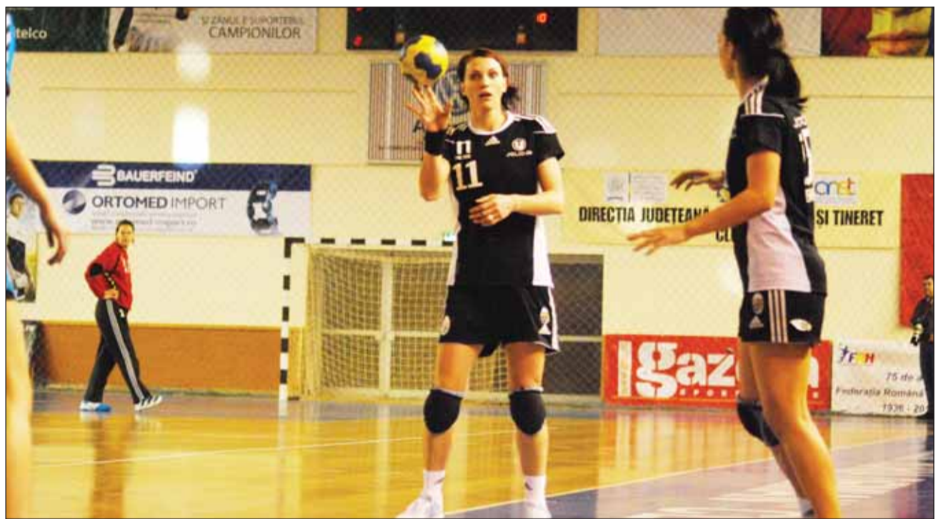
Handbalistele de la „U” Jolidon vor avea mâine o misiune dificilă