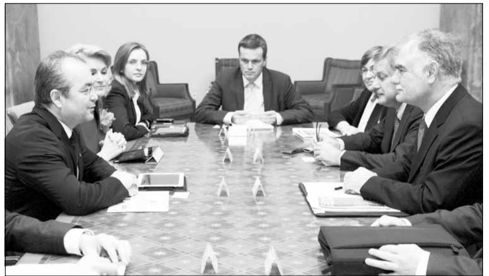
Primul-ministru Emil Boc a discutat ieri la Palatul Victoria cu o delegație a grupului german Bosch

Totodată, compania germană a emis ieri un comunicat de presă în care precizează că există discuții nu doar cu Guvernul României, ci și cu administrația zonei industriale Cluj-Napoca, și că în paralel cu aceste discuții s-au efectuat deja probe de sol.