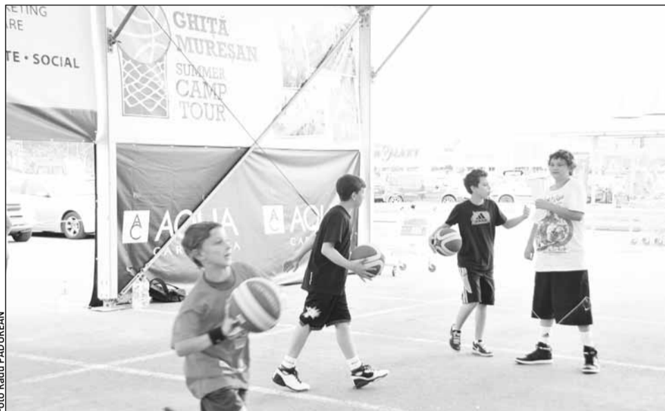
Ghiță Mureșan în mijlocul copiilor.

Tinerii participanți la tabăra vor petrece un timp plăcut împreună, având parte de antrenamente de baschet supervizate direct de Ghiță Mureșan, demonstrații ale unor baschetbaliști de performanță și diverse concursuri cu premii.