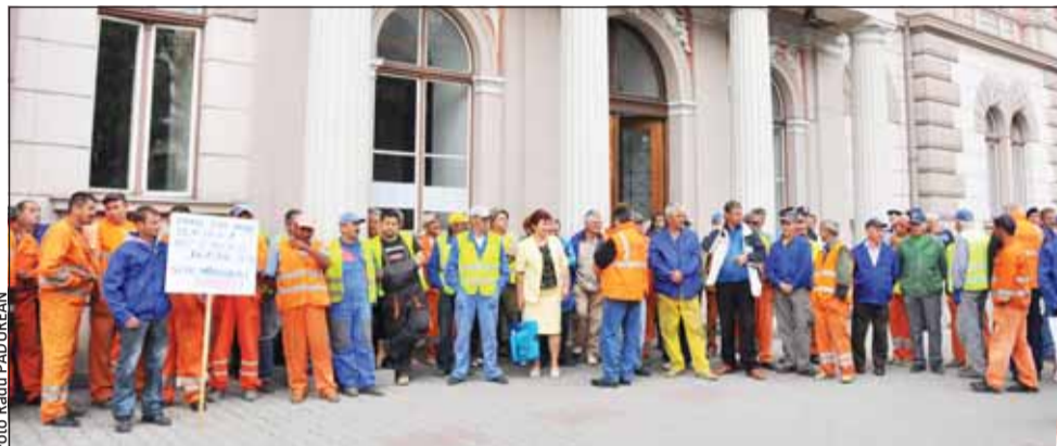
În 21 iunie, angajații RADP au ieșit în stradă, protestând în fața Curții de Apel Cluj împotriva deciziilor prin care judecătorii au dat dreptate firmei zălăuane și i-au lăsat fără salarii.