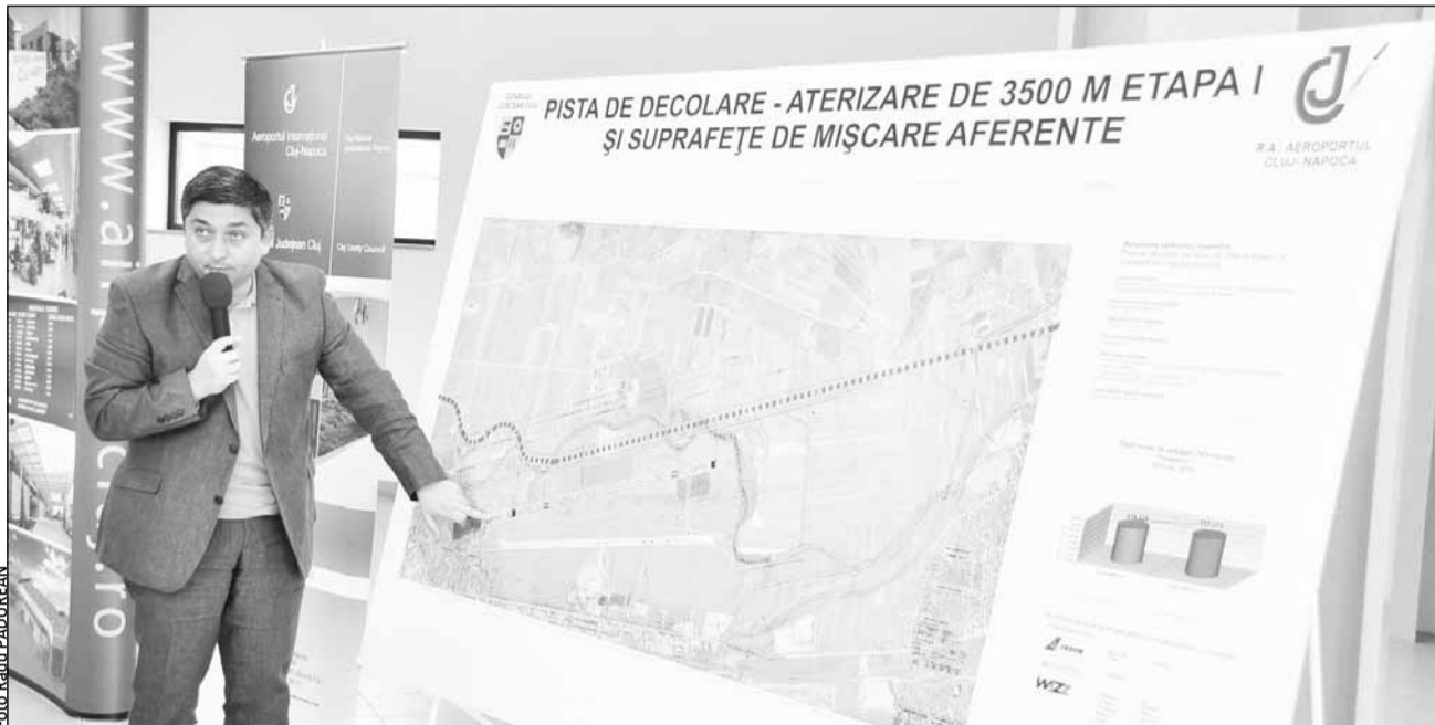
Lucrările la pista Aeroportului clujean vor fi executate de o firmă din Cluj.

Oferta declarată câștigătoare este de 137.808.522 lei fără TVA, adică 32.436.982,99