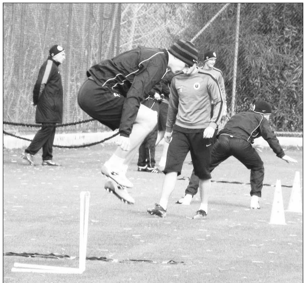
„Studentii” pregătesc returnul Ligii 1 în Antalya

Antrenorul „alb-negrilor” a declarat că echipa sa încă suferă, mai ales în faza de apărare. „Din păcate suferim. Am luat goluri care puteau fi evi-