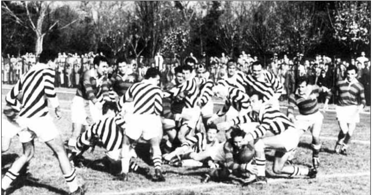
Imagine de la unul din primele meciuri de rugby jucate la Cluj

La Sărbătoarea rugbyului clujean vor participa foștii rugbyști