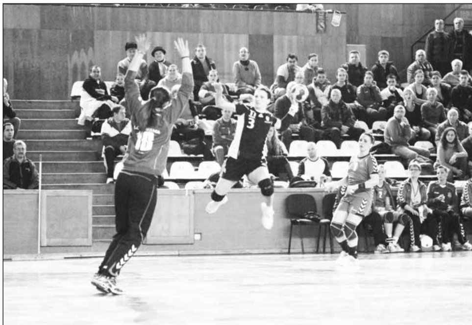
Handbalistele au o ultimă repetiție înainte de meciul cu Dinamo Volgograd